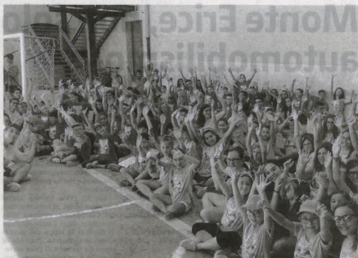
I ragazzi dell'oratorio che potranno usufruire del nuovo campetto. (FOTO CAMPO)